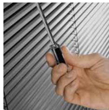
OPTION STORE VÉNITIEN