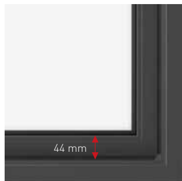
PROFIL DE DORMANT